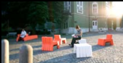
Ljubljanski stol; design: Asobi; foto: Matevž Paternoster

Grozdi predstavljajo socialne mreže in poslovne verige - človeški in razvojni viri, znanje, skupna promocija, finančni viri, proizvodni viri, dobavne verige znotraj enega ali med več različnimi sektorji na nekem geografskem območju. V njih se povezujejo podjetja, raziskovalne institucije, fakultete in finančne institucije, ki sodelujejo na osnovi vzajemnega zaupanja, s skupnimi cilji in nameni, kot so skupen razvoj, promocija, skupni nastopi na tujih trgih ipd.