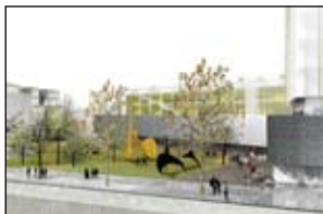
Idejni projekt Centra sodobnih umetnosti – Rog; avtorji: Studio MX-SI, Barcelona, 2009; vir: MO Ljubljana