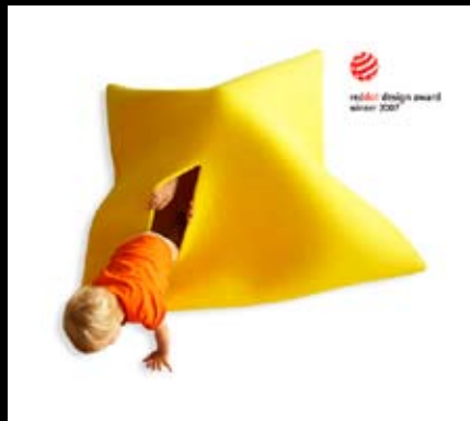
Squareplay - Igrišče za otroke in odrasle, nagrada Red Dot 2007; avtor: OLOOP